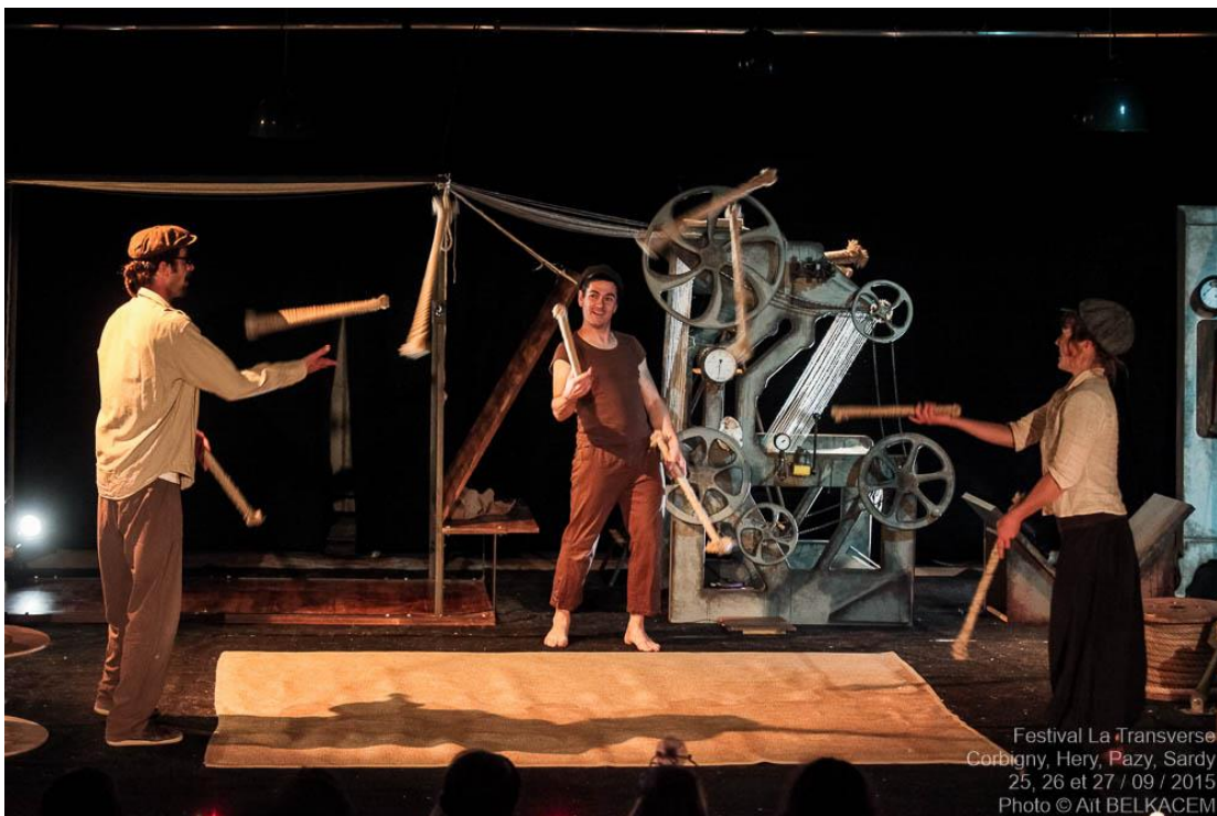
Festival La Transverse Corbigny, Hery, Pazy, Sardy 25, 26 et 27 / 09 / 2015

Chargée de diffusion : Gabrielle NISS // 06 84 14 29 17 // filobal.diff@gmail.com