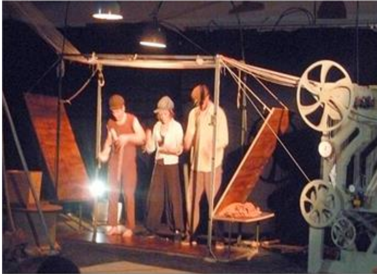
Une curieuse machine à tisser qui donnera bien des soucis aux acteurs et fera bien rire la salle des fêtes riviéroise, pleine à craquer pour l'occasion.

Pour continuer le lien des rencontres et des découvertes, le collectif Saison nomade a proposé, dans le cadre du projet culturel itinérant en Chartreuse, une pause artistique, avec un spectacle mêlant des artistes d'ici et d'ailleurs. Biel, artiste de Chartreuse, avait remporté tous les suffrages dans "Entre-pince" en mai dernier.