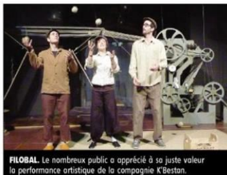
FILOBAL. Le nombreux public a apprécié à sa juste valeur la performance artistique de la compagnie K'Bestan.

Dans un décor d'Emmanuel Laborde, parfaitement en harmonie avec les lieux, puisque reconstituant un atelier de dur la-