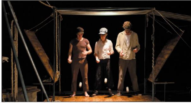
Filobal, un morceau de cirque musical aux airs rétros.

De prime abord, ce Quartier de Lune d'automne semble plus fourni que nos platanes. 16 rendez-vous, proposés par huit compagnies, répartis sur trois jours. Côté chiffres, le week-end s'annonce déjà moins morne. Côté spectacles, qu'y trouve-t-on ? Beaucoup d'amis de Chalon Dans La Rue, grand frère des Quartiers de Lune. On aura pu voir cet été la cie OpUS, Forget Me Not Airlines, Radio Kaizman, Moral Soul, Les Encombrants l'an passé. Et beaucoup de Bourguignons, dont les Neversois de K-Bestan. Avec les Catalans de Solfasirc, ils ont tricoté Filobal, un morceau de cirque musical aux airs rétros. Le pré-