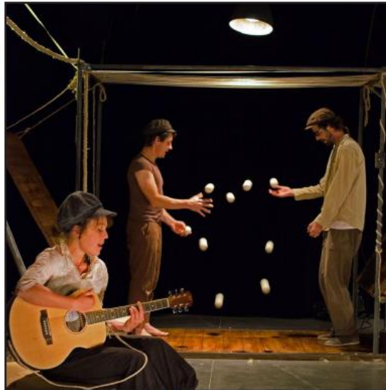
La Cie K Bestan jouera son spectacle Filobal sous le chapiteau pendant les trois jours.